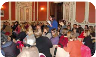
Conseil d'école extraordinaire du 21 février 2013 en mairie.